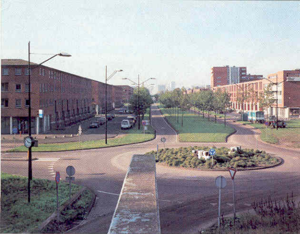
Gezicht op de Bijlmerdreef in de richting van het Arena-gebied (zomer 2002).

hem luisteren, begrijp ik. Ik doe de voordeur open. De man zegt erg veel honger te hebben. Ik bied aan wat boterhammen te maken. Nee, hij heeft liever vijf gulden.