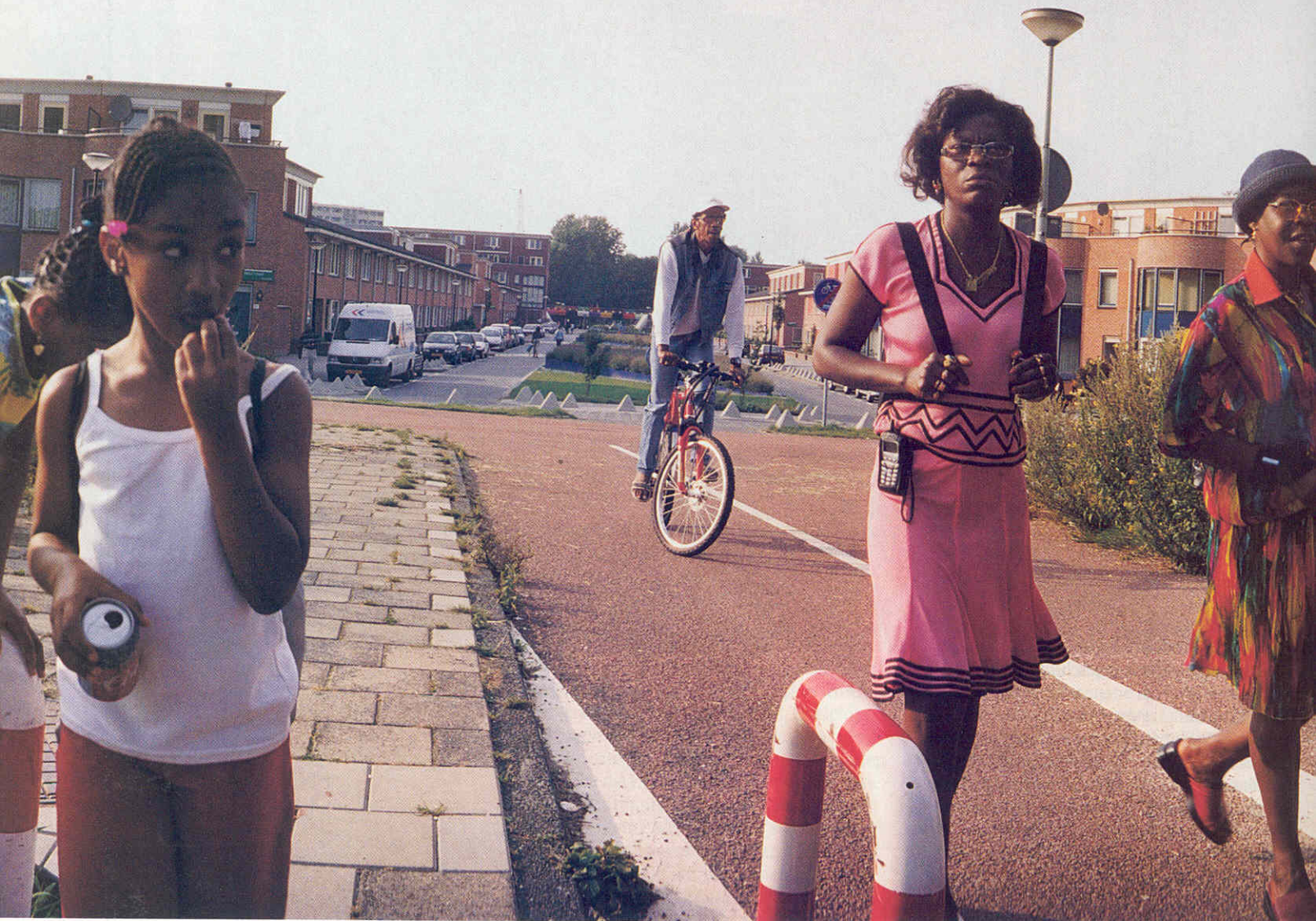
Bewoners van de wijk Vogeltjeswei op weg naar het Kwakoefestival (zomer 2001).

Vrienden komen op bezoek. Steeds is er lof voor de fraaie architectuur en de intelligente indeling van het huis. Het bescheiden vloeroppervlak wordt gecompenseerd door een sterk ruimtelijk gevoel, is de heersende opvatting. En natuurlijk wordt er vrolijk gelachen om de koopprijs. Maar het veelvuldig slenteren naar het raam en de snelle blik naar buiten of de geparkeerde Volvo er nog staat, verraad ook het ongemakkelijke gevoel dat de Bijlmermeer bij sommige bezoekers oproept.