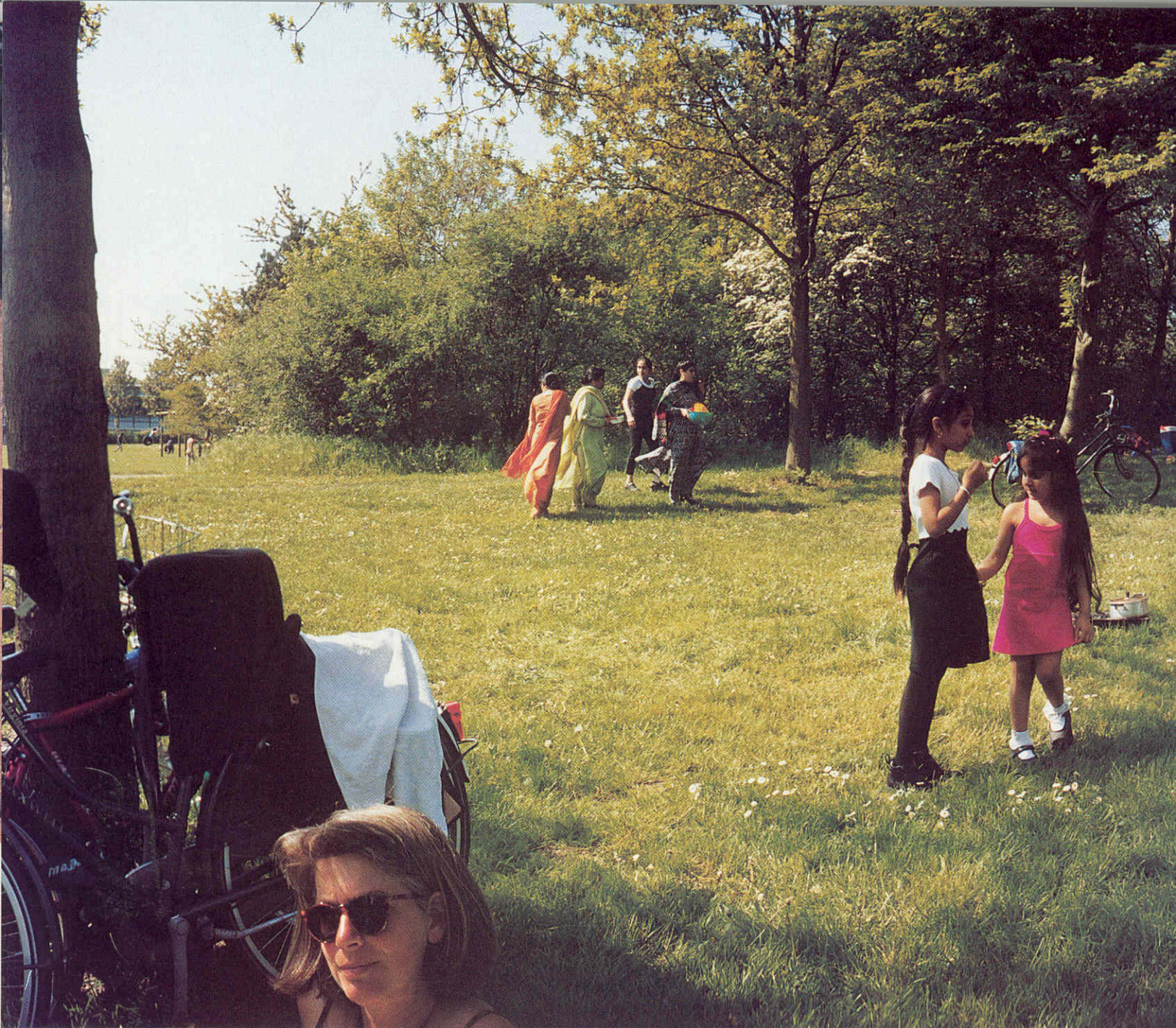
Bewoners van de Bijlmermeer picknicken bij de Gaasperplas (zomer 1999).