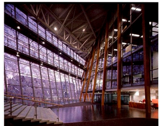
Ontwerp: Erick van Egeraat associated architects, Opdrachtgever: gemeente Alphen aan den Rijn