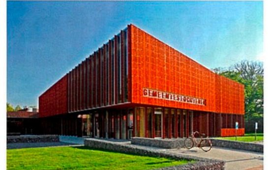
Ontwerp: Zofa, Opdrachtgever: gemeente Slochteren