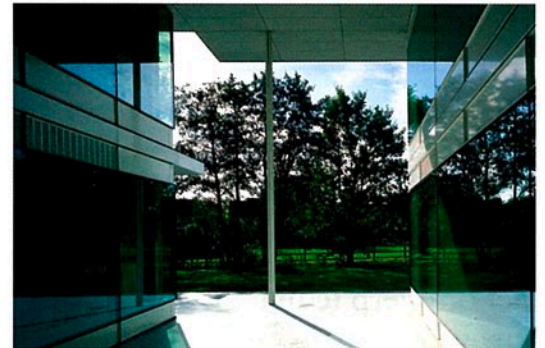
Ontwerp: Claus en Kaan Architecten, Opdrachtgever: gemeente Tynaarlo