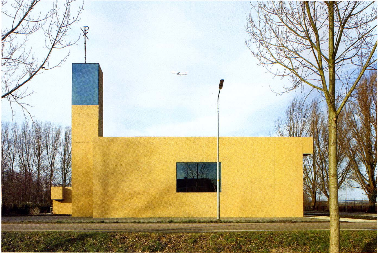
青い空と緑の中、大地に寄り添うようにして建つ教会。横長の窓や高さを抑えた塔が、来る人を出迎える。背後の林の上をスキポール空港に発着する飛行機が飛び交う。